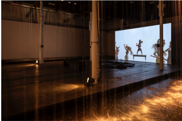
Calling for Rain , 2021, Commissioned for the Children's Biennale, by the National Gallery of Singapore, Single-channel HD video, color, sound, 30'42" looped.

de vie est dépendant de la forêt et qui a été menacé par la proposition de créer des barrages près de leurs habitations, ce qui a été une source d'inspiration pour la création de cette œuvre.