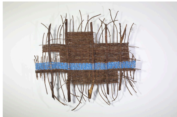
Prey 1 , 2026, Installation (woods, woven vines and zinc), 166 x 160 x 35 cm

Les œuvres Spirit House et Prey ont été créées pour continuer l'exploration continue de l'artiste sur la relation entre la nature, la mémoire et le lieu. Pour l'artiste, Spirit House peut être comprise comme Pteah Neak Ta — la demeure de l'esprit gardien de la terre, ou le « Maître de la Terre ». Prey , qui signifie « forêt », invite à réfléchir à la manière dont la diversité biologique reflète la diversité climatique, révélant ainsi les systèmes interconnectés qui façonnent à la fois les paysages naturels et culturels.