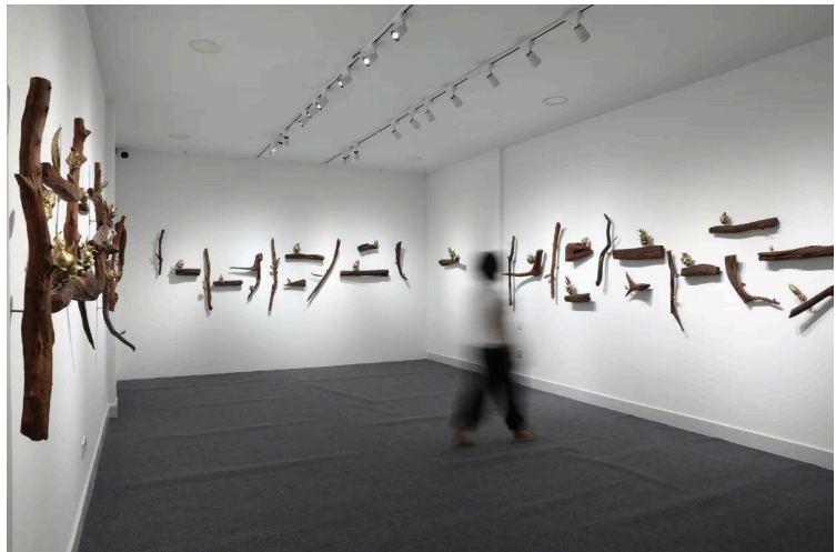
Dragon Farm , 2025, Installation of 43 woods, brasses, variable dimensions

Après avoir planté cette graine dans un espace désert près de chez eux, les garçons se sont relayés pour l'arroser jusqu'à la voir devenir un arbre en très bonne santé qui a redonné vie à la vallée. L'arbre n'était pas très grand mais ces racines étaient profondes et aidaient la terre à se renouveler et l'écosystème de la vallée à se développer. Les garçons décidèrent donc de nommer cet arbre l'Arbre Véritable. Toutefois, l'arbre n'a pas su rester enraciné quand la prochaine tempête s'est déclarée. Pendant plus d'un an, le village a cru à la fin de ce miracle quand soudain les premières pousses des graines disséminées pendant la tempête commencèrent à pousser. Ces graines donnèrent naissance à une forêt entière, ce qui assura la survie de la biodiversité et du village proche. Les villageois rendent depuis hommage à l'Arbre Véritable et à la forêt en la nommant la Forêt de l'Arbre Véritable.