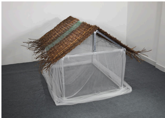
Spirit House 1 , 2026, Installation (metal, woven vines and zinc, embroidery of 4 gates on mosquito net, unfired clay sculpture)