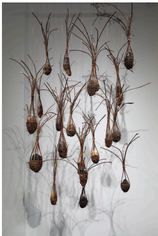
Seeds (mountain landscape) , 2026, Installation of stones, woven vines, variable dimensions

Les œuvres Dragon Farm , Seeds , et Root en sont issues tandis que Spirit House , Prey et The Fences sont des séries d'œuvres créées spécifiquement pour l'exposition Spirit, Body and Land dans la poursuite de ce travail.