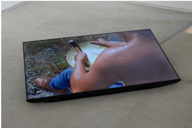
Das Pralung (Rousing Spirits) , 2024, Single-channel HD video, color, sound, 22'29" looped

L'exposition propose un dialogue entre l'écologie, la spiritualité et l'expérience humaine, encourageant le public à réfléchir à sa relation avec les environnements qu'il habite.